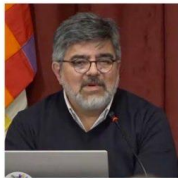
juez Raul Horacio Ojeda

El Movimiento Empresarial Antibloqueos (MEAB) presentó este martes una denuncia penal por presunto abuso de autoridad contra el juez Raúl Horacio Ojeda, titular del Juzgado Nacional del Trabajo N° 63. La causa fue asignada por sorteo al Juzgado Criminal y Correccional Federal N° 6, bajo el expediente CFP 1796/2026.